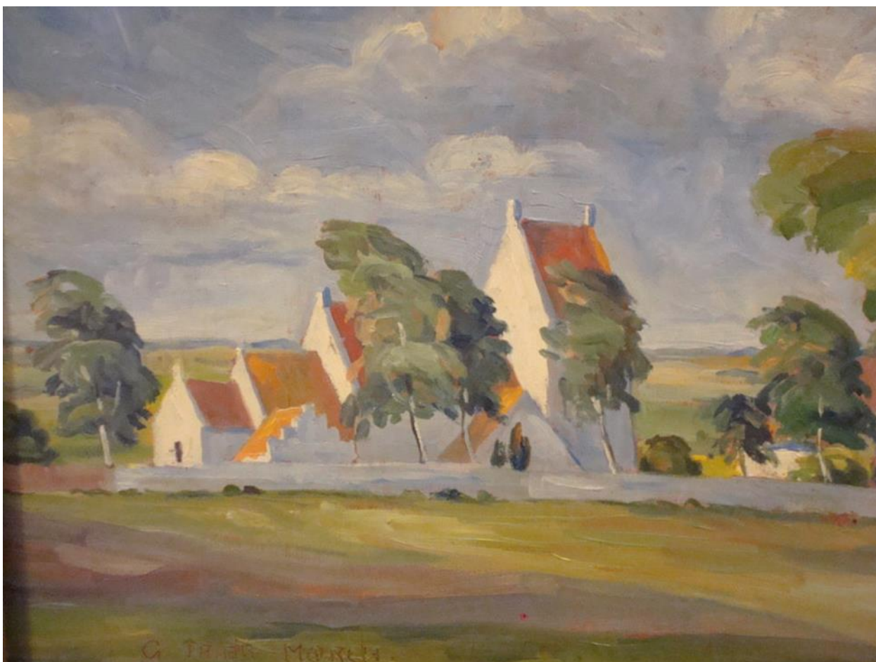
Vallekilde Kirke set fra nordøst – Gave fra lokalt dødsbo, malet af Gudrun Trier Mørch. Kan ses i kirken.

På opfordring af nogle af vores gode medlemmer i Klub Odsherred har vi taget udfordringen op og tilbyder nu den første del af en oplevelsesrække med besøg på et udpluk af de mange fine kirker, vi har i Odsherred. I 2023 har vi planlagt 2 kirkebesøg, - aktuelt her med det første i Vallekilde og Hørve. På vores oplevelser er det efterhånden blevet en fast tradition, at vi - i pagt med kvaliteten af de lokale råvarer - indeholder lidt godt til ganen for at bidrage til at sætte den rette stemning og glæde til et inspirerende og varmt socialt samvær efter oplevelsen, så vi fortsat udbygger vores fælles relationer i Klub Odsherred.